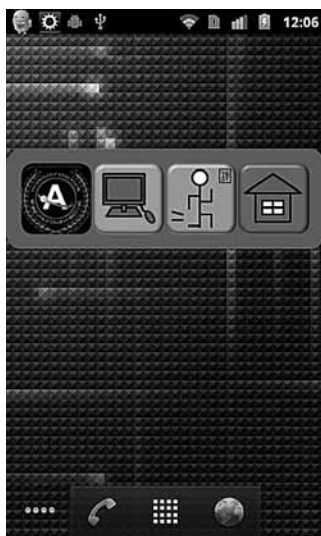
図 4 ウィジェットを配置した例

ト (図 4) や、学内の Wi-Fi の電波強度に応じて自動的に所在情報が更新される機能がある。