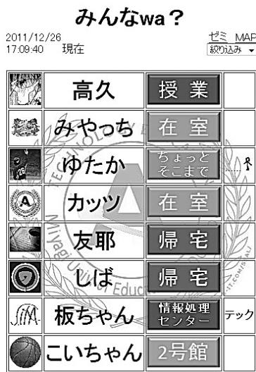
図 2 所在情報の表示