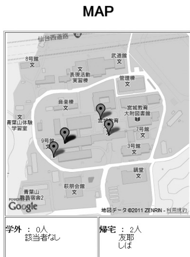
図 3 所在情報の地図表示