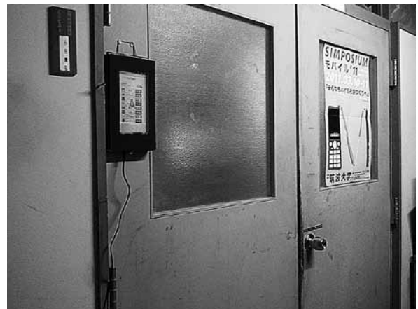
図8 研究室入り口の掲示用タブレット端末

本研究で開発したシステムは、すでに運用を開始している。掲示用として研究室の入り口にタブレット端末が設置してあり、トップページを表示させておくことで常にメンバーの所在を確認できるようにしている(図8)。今後、実運用の中で問題点が見付かることや、ユーザからの意見や要望が寄せられることが考えられる。それらを取り入れてより便利なシステムに改善していくことが今後の課題である。