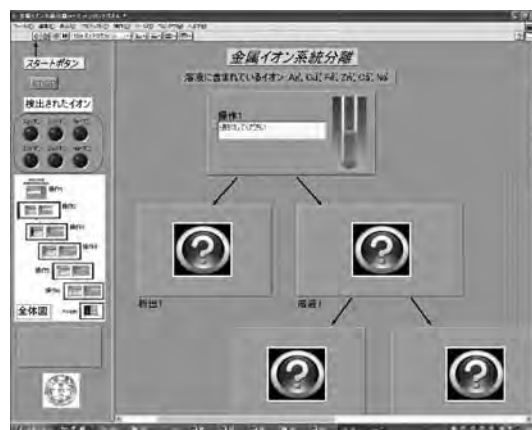
図3 金属イオン系統分離シミュレーション

『金属イオン系統分離シミュレーション』のプログラムを図3に示す。操作方法は、操作1の項目で実験操作を選択すると、選択した内容に沿って、操作1以降のクエスチョンマークの項目が変化し、あとは表示された指示に従って操作していくようになっている。