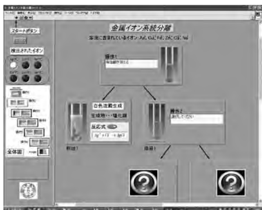
図4 操作1で正しい操作を選択したときのシミュレーション画面

る。この項目は、画面をスクロールさせても位置が変わらない。そのため、実験の全体図と合わせて、常に実験の進行具合を確認することが可能となる。