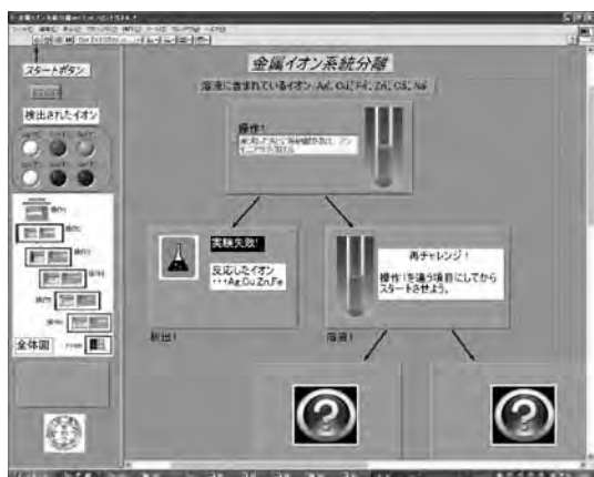
図5 操作1で間違った操作を選択したときのシミュレーション画面

一方、操作1において、「希塩酸を加える」という正解以外を選択すると図5のようになる。「析出*」（*は数字）の項目では、実験失敗と表示される。「溶液*」（*は数字）の項目では、次のような操作をすればよいかが表示される。図5の場合は2種類以上のイオンが反応しているため、実験はやり直しとなる。これは、「検出されるイオン」の項目で複数のランプが点灯することで分かる仕組みになっている。一方で、どのイオンとも反応しない試薬を加える選択肢を選んだ場